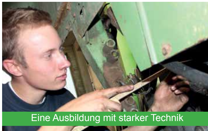
Eine Ausbildung mit starker Technik