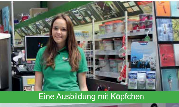
Eine Ausbildung mit Köpfchen

im Groß- und Außenhandel Fachrichtung Großhandel