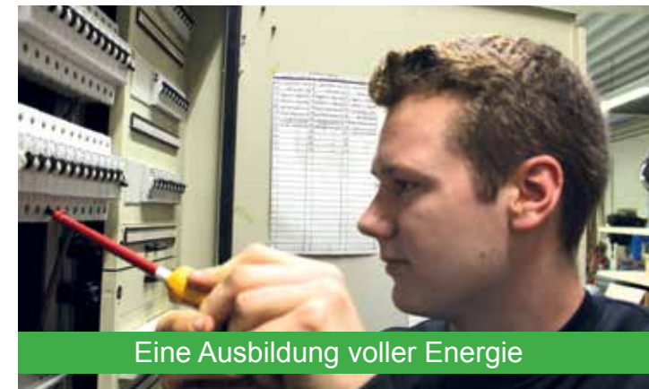
Eine Ausbildung voller Energie

Fachrichtung Energie- und Gebäudetechnik